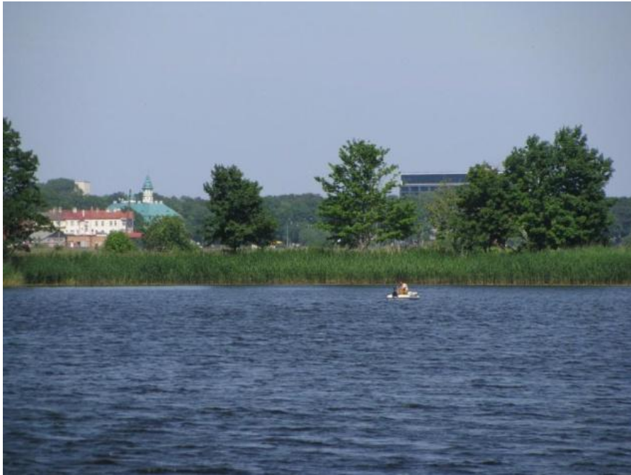
Skats uz Majoriem pāri Lielupes līkumam un Baņķim no Slokas ielas apkaimes pie Dubultu kapiem

Otru nozīmīgāko pilsētas panorāmu iezīmē Lielupes līkums starp Dubultiem un Majoriem . Izteismīgā lokveida panorāma uztverama no dažādām Lielupes krastmalas vietām. Šī pilsētas daļa vienlaikus ir gan Jūrmalas centrs, gan arī viduklis - šaurākā vieta starp upi un jūru. Arī šai panorāmai raksturīga mežu līnija, virs kuras izklaidus paceļas lielmēroga būves, ar priekšplānā pamīšus izvietotām dažām vēsturiskajām būvēm, piemēram, Dubultu luterāņu baznīcu vai viesnīcu „Majori” un izteismīgām jaunbūvēm, piemēram, Majoru pamatskolas sporta zāli. Ainavas dinamiskais elements šajā panorāmā ir vilcieni, kas kursē pa dzelzceļu gar Lielupes krastu. Būtiski, ka Jūrmalas panorāma pat 270° plašā leņķī lieliski uztverama no pretējā krasta, kas atrodas Salas pagasta teritorijā.