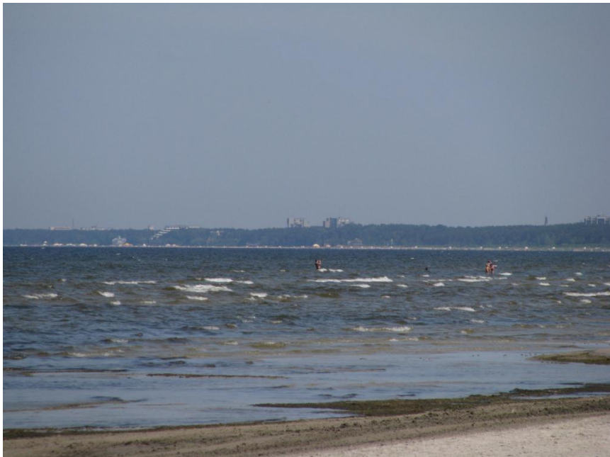
Rīgas jūras līča panorāma skatā no pludmales ūdensatraciju parka “Nemo” apkaimē

Pilsētai izteikti unikāla un tās izstiepto raksturu pasvīturojoša ir Rīgas jūras līča krasta ainava . Tā uztverama no dažādām līča piekrastes vietām un ir katreiz mainīga, no katras vietas citāda. Visā līča garumā uztverams liedags ar priežu meža līniju fonā, ko vietām, paceļoties virs koku galotnēm vai „iznākot” pludmalē, pārtrauc lielmēroga (galvenokārt viesnīcu) būves.