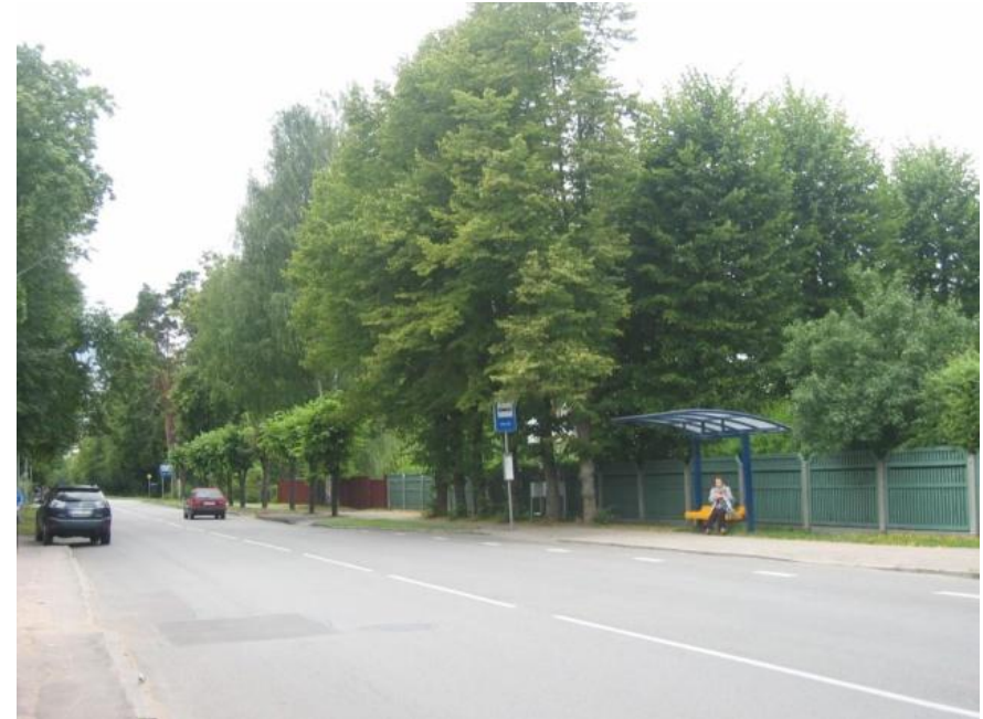
Mellužu prospekta perspektīva, Kauguru virziens