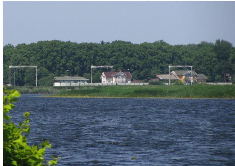
Skats pāri Lielupes līkumam uz Majoru vēsturisko apbūvi