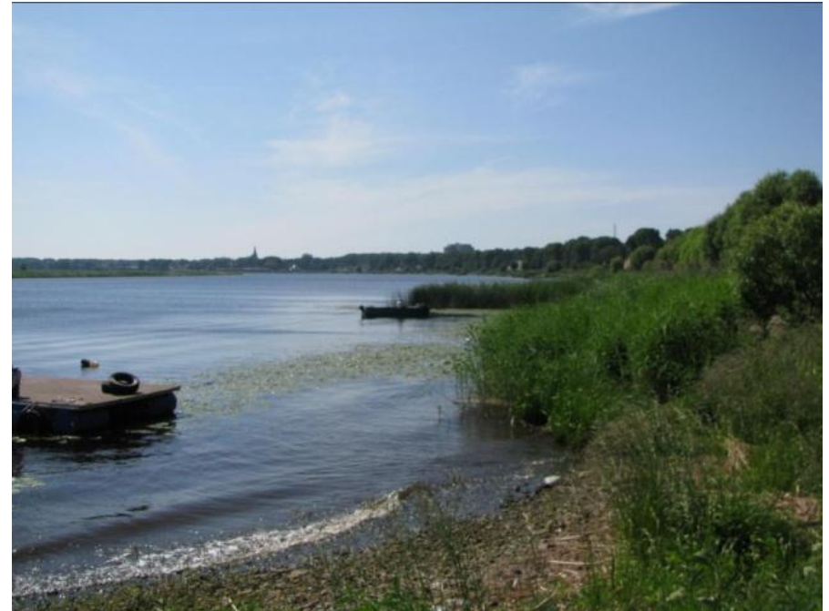
Lielupes līkums skatā no piestātnes Rīgas ielas galā