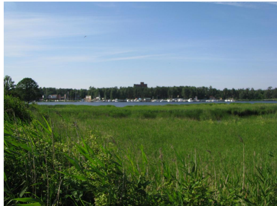
Jūrmalas Lielupes krasta panorāma skatā no uzbēruma pirms dzelzceļa tilta