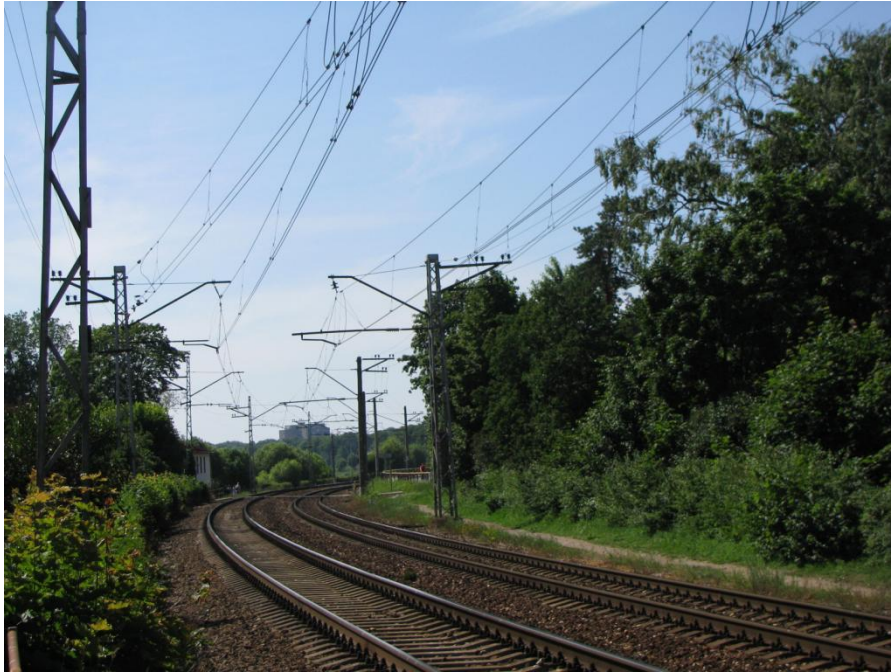
Sliežu ceļi Smilšu ielas pārejas tuvumā