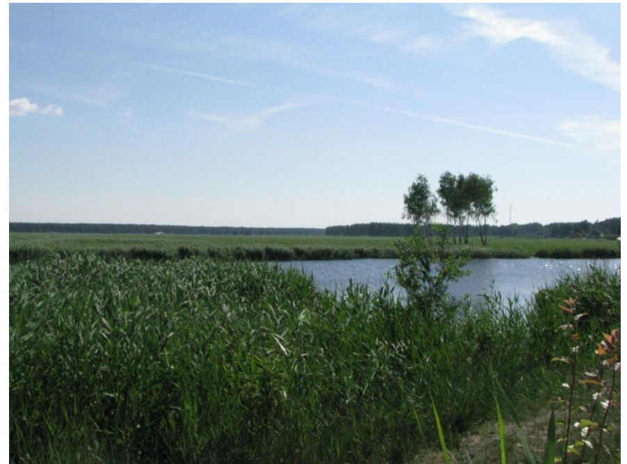
Skats uz Lielupes grīvas pļavām no Tiklu ielas apkārtnes Bulluciemā