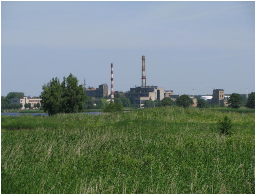
Slokas papīrfabrikas panorāma skatā no Tītara dambja Salas pagastā

Lai arī Slokas papīrfabrikas ģindenis ir izteiksmīgs, kaut spokains pilsētas panorāmas papildinājums, tuvā nākotnē būvēm neatrodot piepildījumu „otrai dzīvei”, fabrikas brūkošās būves ne vien apdraudēs apkārtnes iedzīvotājus, bet arī pievilinās apšaubāmus sabiedrības elementus. Neskatoties uz industriālā mantojuma vērtībām, specifiskās novietnes dēļ fabrikai ir maz cerību uz kādu alternatīvu kustību interesi. Tādejādi fabrikas tēls agri vai vēlu saglabāsies vien vēstures fotogrāfijās un iespējams, kā vienīgā norāde uz agrāko godību paliks fabrikas skurstenis. Kā īpaši šī laika akcenti fabriku skursteņi arī daudzviet citās pilsētās kļuvuši par pieminekļiem agrākajai industriālajai rosībai.