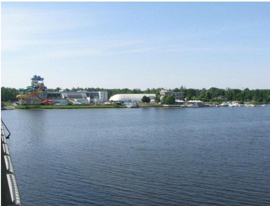
Jūrmalas Lielupes krasta panorāma skatā no auto tilta

Pilsētas panorāma , ko pirmo ierauga Jūrmalas apmeklētāji iebraucot pa pilsētas vārtiem - šķērsojot dzelzceļa tiltu un auto tiltu. Šai panorāmāi patlaban nav izteikta silueta un tās nozīmību akcentējošu objektu, izņemot Līvu akvaparku, kas ar krāsainajām nobraucienu caurulēm fasādē vēsta par sagaidāmajiem ūdenspriekiem un jautrību.