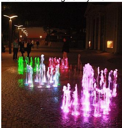
Strūklakas Turaidas ielā