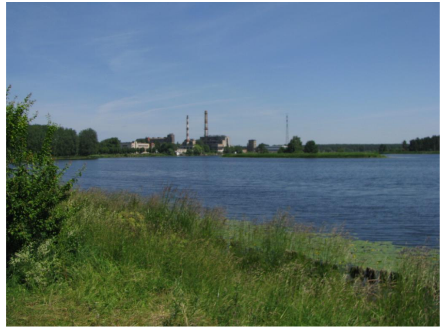
Slokas papīrfabrikas panorāma skatā no dambja pie Vecslocenes upītes ietekas