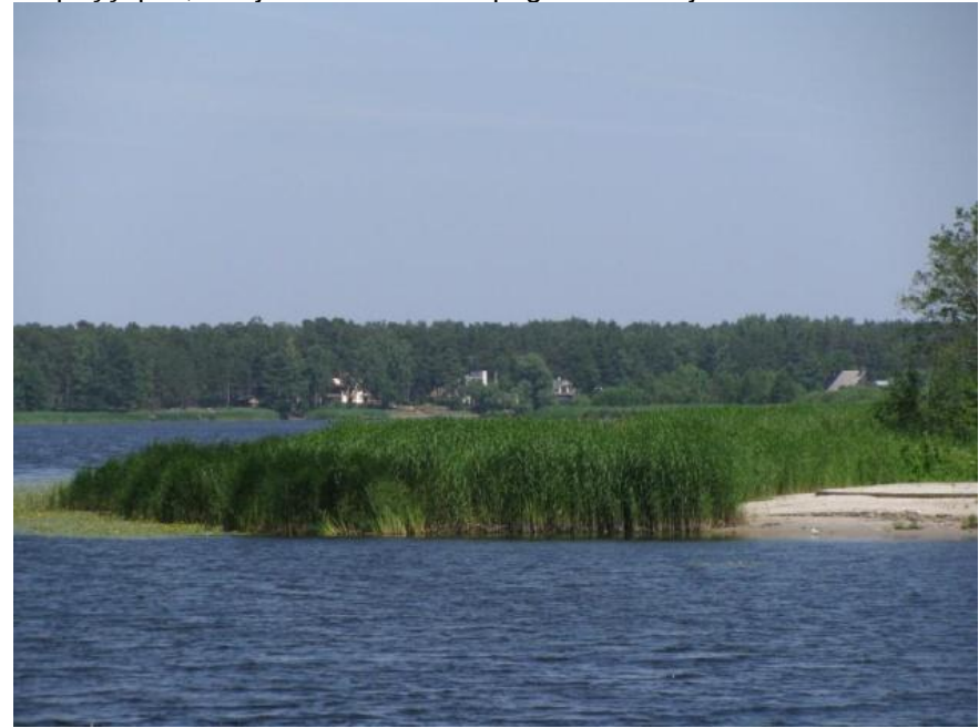
Skats pār Lielupi no Spuņņupes kreisā krasta