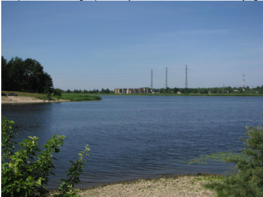
Skats pār Lielupi no Varkaļu kanāla labā krasta

Citi uztveres punkti Lielupes labajā krastā – panorāmas skati uz Jūrmalu paveras no vairākām vietām, kur Jūrmalas apvedceļš (A10) pietuvojas Lielupei. Tāda vieta ir gan pie Varkaļu kanāla, kas ir Jūrmalas teritorija, gan pie Spuņņupes, kas jau atrodas Salas pagasta teritorijā.