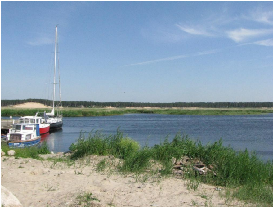
Skats pār Lielupi uz Balto kāpu no Tiklu ielas apkārtnes Bulluciemā

Vairākums dabas teritoriju jau tiek aizsargātas sugu un biotopu saglabāšanai. Izvērtējot dabas elementus pilsētas ainavas kontekstā, to nozīmība nosakāma saistībā ar konkrētajā teritorijā iecerēto attīstības koncepciju. Vai dabas objekts un apkārtējā teritorija būtu jāaizsargā kā pilsētai raksturīgās un vērtīgās ainavas sastāvdaļa, jeb dabiska, neskarta, pat mežonīga dabas teritorija drīzāk papildina jaunu attīstības ieceri - tas izvērtējams katrā gadījumā individuāli ar apbūves priekšlikumu, detālpļānojumu, vai vizuālās ietekmes analīzi.