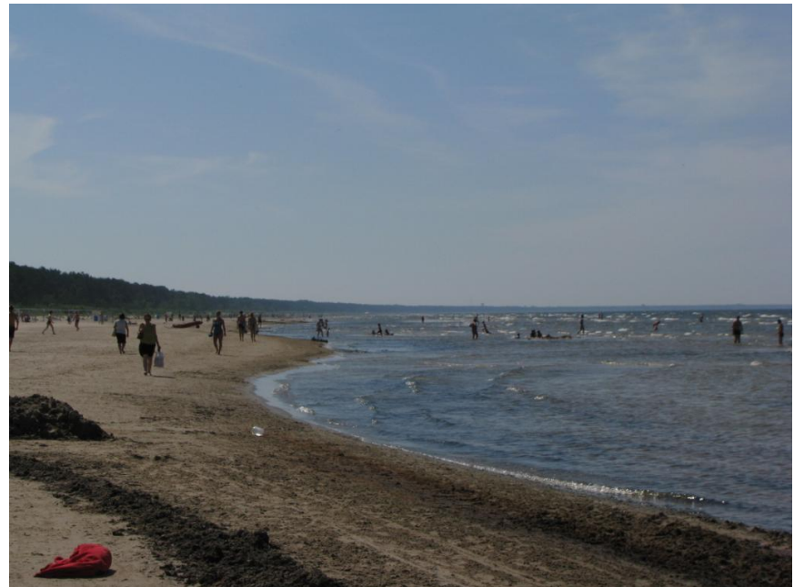
Rīgas jūras līča panorāma skatā no Dubultu pludmales Slokas ielas apkaimē