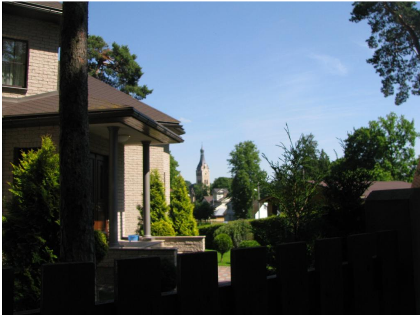
Skats uz Dubultu baznīcu no Slokas ielas

Lai īpašās skatu vietas identificētu, veicama papildus izpēte. Tikai tādā gadījumā iespējams nozīmīgās skatu vietas aizsargāt un tām uzstādīt kādus īpašus noteikumus.