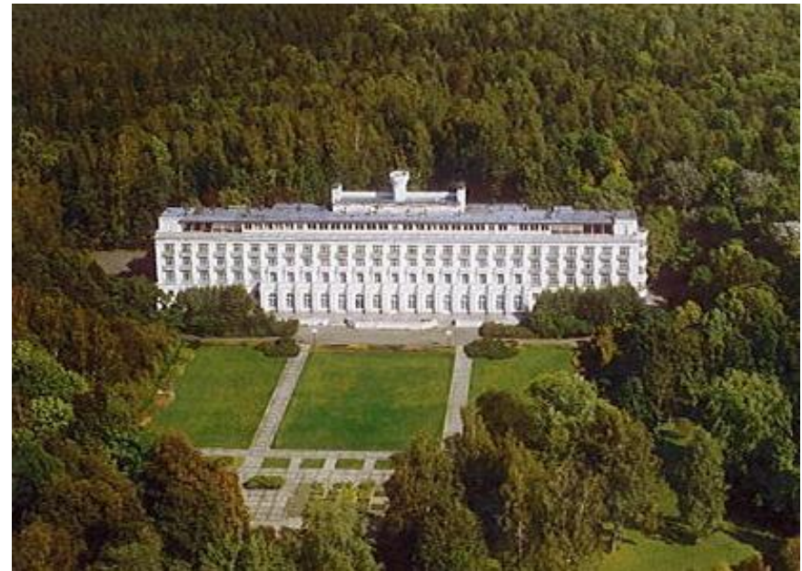
Skats uz Ķemeru viesnīcu un parku no putna lidojuma