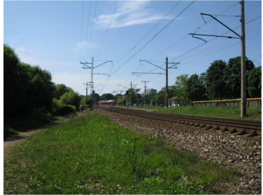
Sliežu ceļi skatā uz Majoru staciju