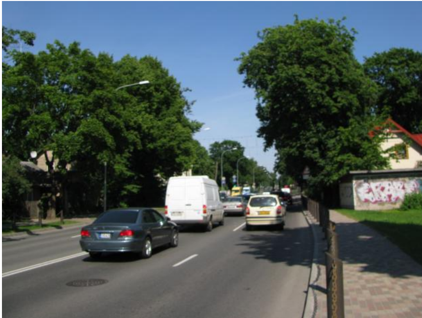
Lienes ielas perspektīva, Rīgas virziens

tikai savrupmāju un vasarnīcu rajonos, bet arī Kauguros, kur piecu un deviņu stāvu daudzdzīvokļu mājas ielu perspektīvās eksponējas perpendikulāri ielai.