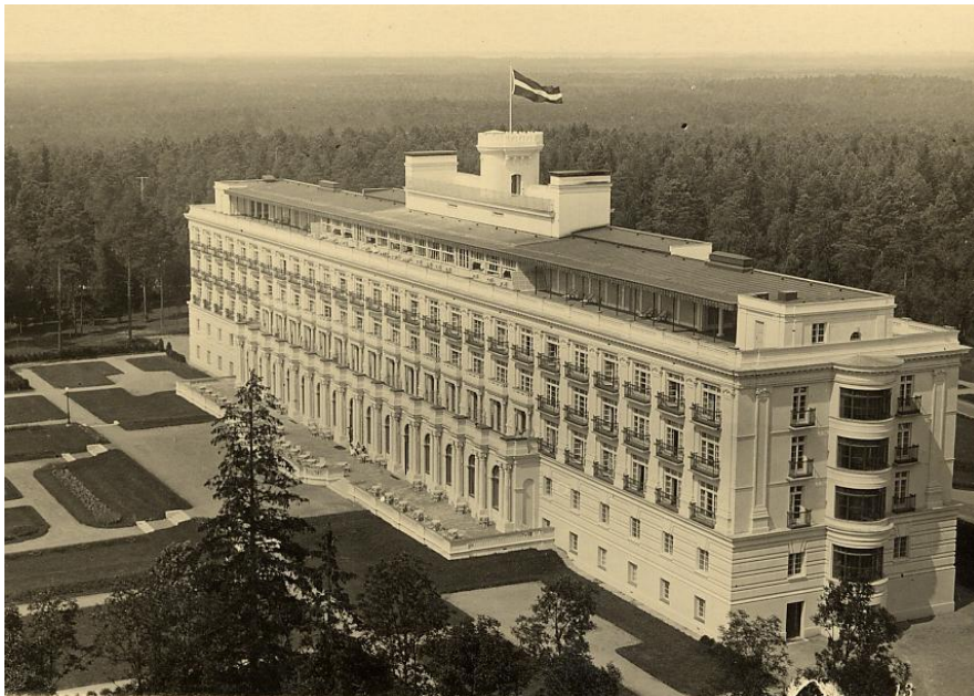
Skats uz Ķemeru viesnīcu no ūdenstora skatu laukuma

Ķemerose definējami raksturīgie un nozīmīgie skatu leņķi, kur šī panorāma aizsargājama (no ūdenstora skatu laukuma, no viesnīcas parka), nepieciešamības gadījumā pieprasot veikt vizuālās ietekmes analīzi.