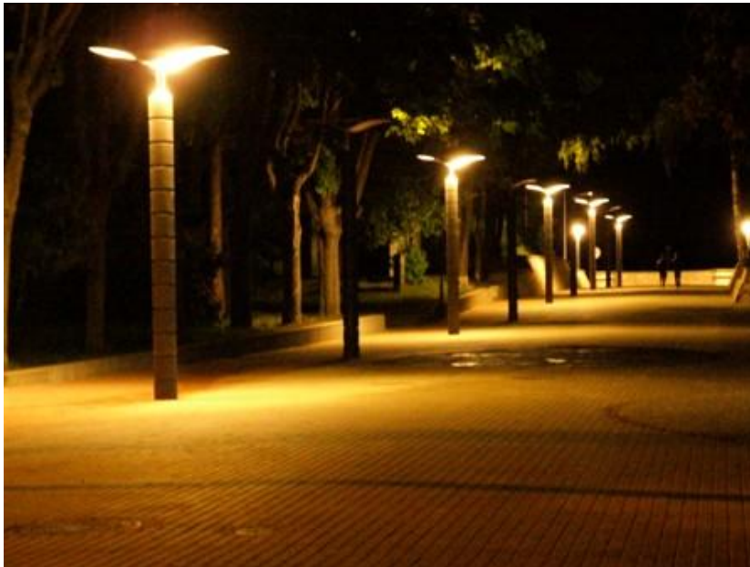
Turaidas ielas izgaismojums

Nakts panorāma – būtiska kūrortpilsētas vizītkarte.