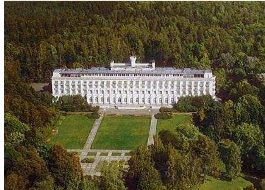
Skats uz Ķemeru viesnīcu un parku no putna lidojuma