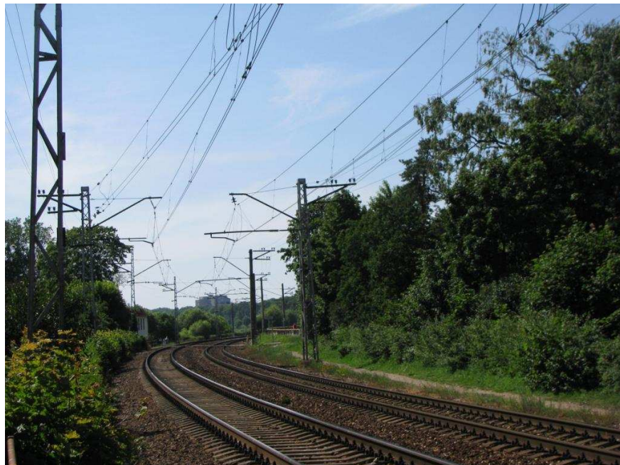
Sliežu ceļi Smilšu ielas pārejas tuvumā