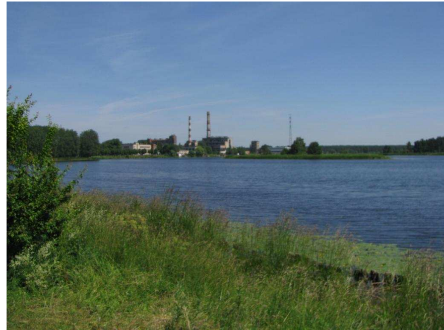
Slokas papīrfabrikas panorāma skatā no dambja pie Vecslocenes upītes ietekas