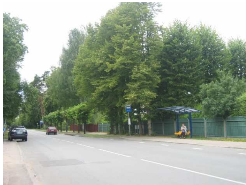
Mellužu prospekta perspektīva, Kauguru virziens