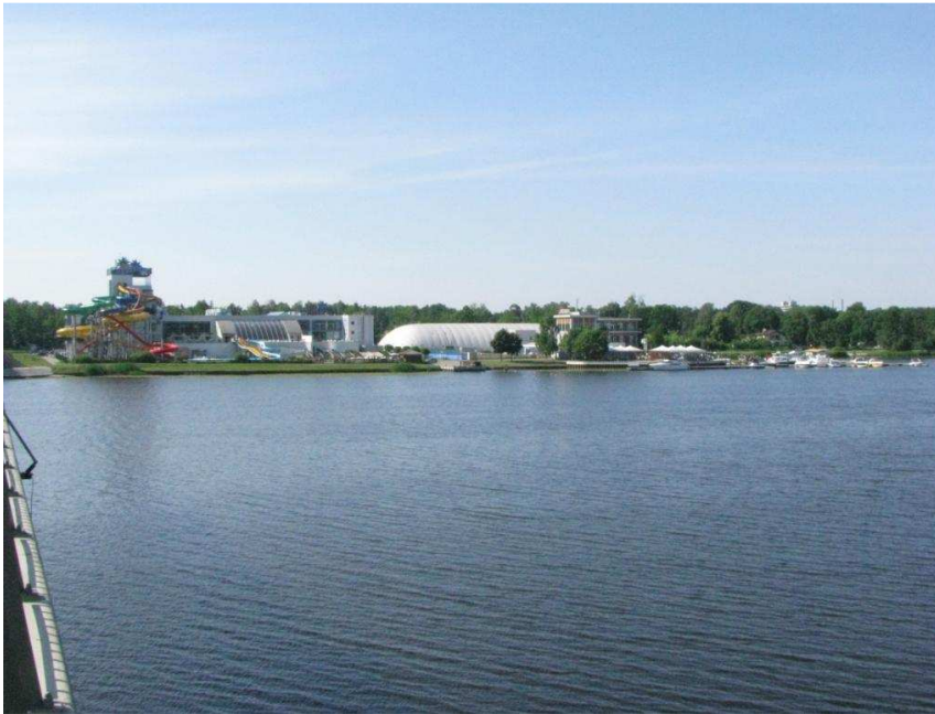
Jūrmalas Lielupes krasta panorāma skatā no auto tilta

Pilsētas panorāma , ko pirmo ierauga Jūrmalas apmeklētāji iebraucot pa pilsētas vārtiem - šķērsojot dzelzceļa tiltu un auto tiltu. Šai panorāmai patlaban nav izteikta silueta un tās nozīmību akcentējošu objektu, izņemot Līvu akvaparku, kas ar krāsainajām nobraucieni caurulēm fasādē vēsta par sagaidāmajiem ūdenspriekiem un jautrību.