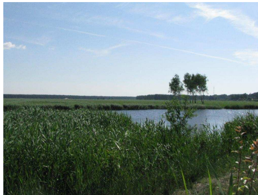
Skats uz Lielupes grīvas pļavām no Tīklu ielas apkārtnes Buļļuciemā