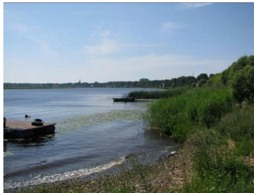
Lielupes līkums skatā no piestātnes Rīgas ielas galā