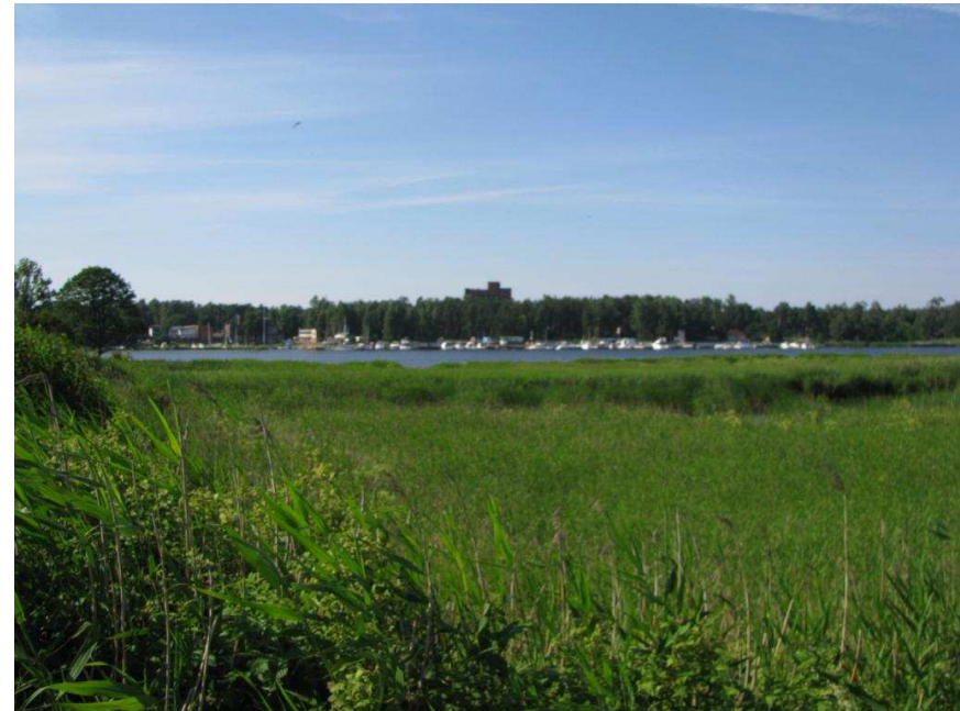
Jūrmalas Lielupes krasta panorāma skatā no uzbēruma pirms dzelzceļa tilta