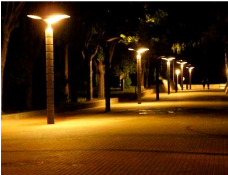
Turaidas ielas izgaismojums

Nakts panorāma – būtiska kūrortpilsētas vizītkarte.