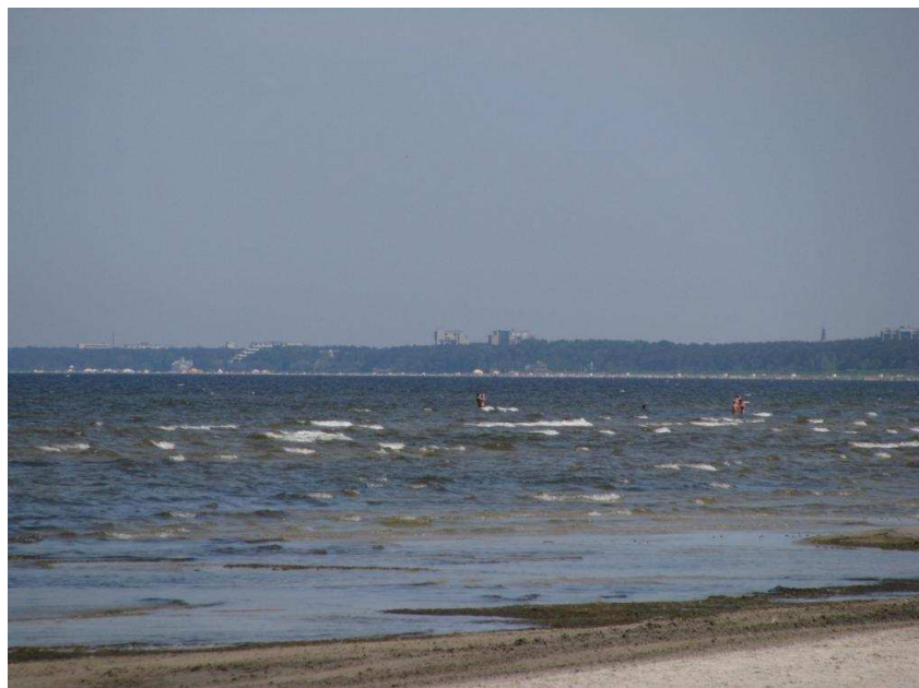
Rīgas jūras līča panorāma skatā no pludmales ūdensatrakciju parka “Nemo” apkaimē

Pilsētai izteikti unikāla un tās izstiepto raksturu pasvītīrojoša ir Rīgas jūras līča krasta ainava . Tā uztverama no dažādām līča piekrastes vietām un ir katreiz mainīga, no katras vietas citāda. Visā līča garumā uztverams liedags ar priežu meža līniju fonā, ko vietām, paceļoties virs koku galotnēm vai „iznākot” pludmalē, pārtrauc lielmēroga (galvenokārt viesnīcu) būves.