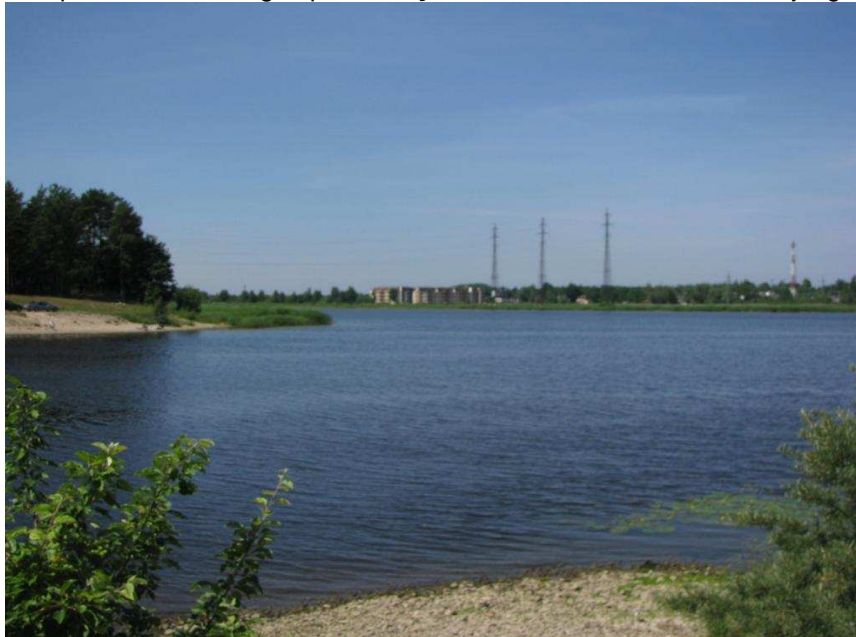
Skats pār Lielupi no Varkaļu kanāla labā krasta

Citi uztveres punkti Lielupes labajā krastā – panorāmas skati uz Jūrmalu paveras no vairākām vietām, kur Jūrmalas apvedceļš (A10) pietuvojas Lielupei. Tāda vieta ir gan pie Varkaļu kanāla, kas ir Jūrmalas teritorija, gan pie Spuņņupes, kas jau atrodas Salas pagasta teritorijā.