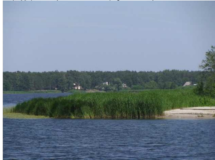
Skats pār Lielupi no Spuņņupes kreisā krasta