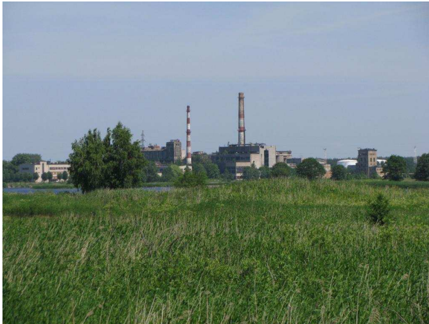
Slokas papīrfabrikas panorāma skatā no Tītara dambja Salas pagastā

Lai arī Slokas papīrfabrikas ģindenis ir izteiksmīgs, kaut spokains pilsētas panorāmas papildinājums, tuvā nākotnē būvēm neatrodot papildījumu „otrai dzīvei”, fabrikas brūkošās būves ne vien apdraudēs apkārtnes iedzīvotājus, bet arī pievilinās apšaubāmus sabiedrības elementus. Neskatoties uz industriālā mantojuma vērtībām, specifiskās novietnes dēļ fabrikai ir maz cerību uz kādu alternatīvu kustību interesi. Tādejādi fabrikas tēls agri vai vēlū saglabāsies vien vēstures fotogrāfijās un iespējams, kā vienīgā norāde uz agrāko godību paliks fabrikas skurstenis. Kā īpaši šī laika akcenti fabriku skursteņi arī daudzviet citās pilsētās kļuvuši par pieminekļiem agrākajai industriālajai rostībai.