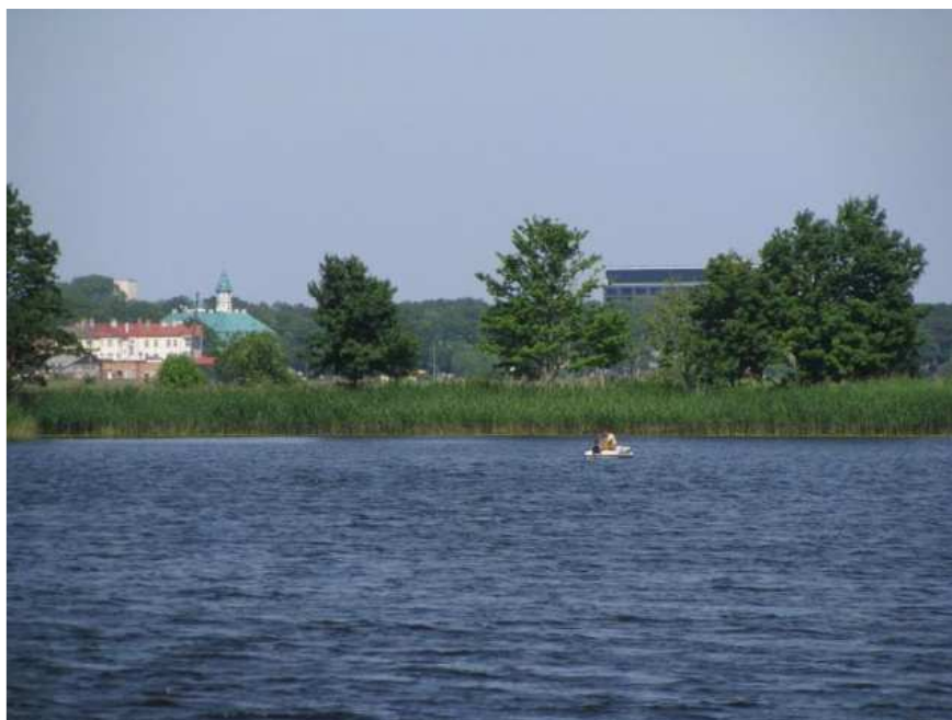
Skats uz Majoriem pāri Lielupes līkumam un Baņķim no Slokas ielas apkaimes pie Dubultu kapiem

Otru nozīmīgāko pilsētas panorāmu iezīmē Lielupes līkums starp Dubultiem un Majoriem . Izteiksmīgā lokveida panorāma uztverama no dažādām Lielupes krastmalas vietām. Šī pilsētas daļa vienlaikus ir gan Jūrmalas centrs, gan arī viduklis - šaurākā vieta starp upi un jūru. Arī šai panorāmai raksturīga mežu līnija, virs kuras izklaidus paceļas lielmēroga būves, ar priekšplānā pamīšus izvietotām dažām vēsturiskajām būvēm, piemēram, Dubultu luterāņu baznīcu vai viesnīcu „Majori” un izteiksmīgām jaunbūvēm, piemēram, Majoru pamatskolas sporta zāli. Ainavas dinamiskais elements šajā panorāmā ir vilcieni, kas kursē pa dzelzceļu gar Lielupes krastu. Būtiski, ka Jūrmalas panorāma pat 270° plašā leņķī lieliski uztverama no pretējā krasta, kas atrodas Salas pagasta teritorijā.