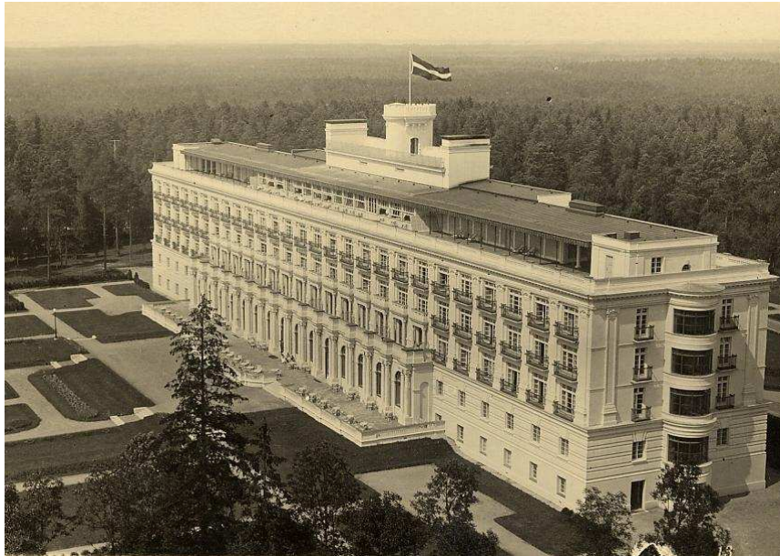
Skats uz Ķemeru viesnīcu no ūdenstora skatu laukuma

Ķemeru definējami raksturīgie un nozīmīgie skatu leņķi, kur šī panorāma aizsargājama (no ūdenstora skatu laukuma, no viesnīcas parka), nepieciešamības gadījumā pieprasot veikt vizuālās ietekmes analīzi.