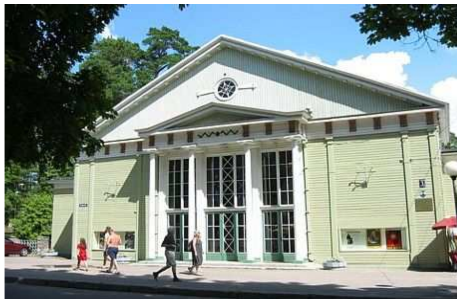
Dzintaru koncertzāles mazā zāle