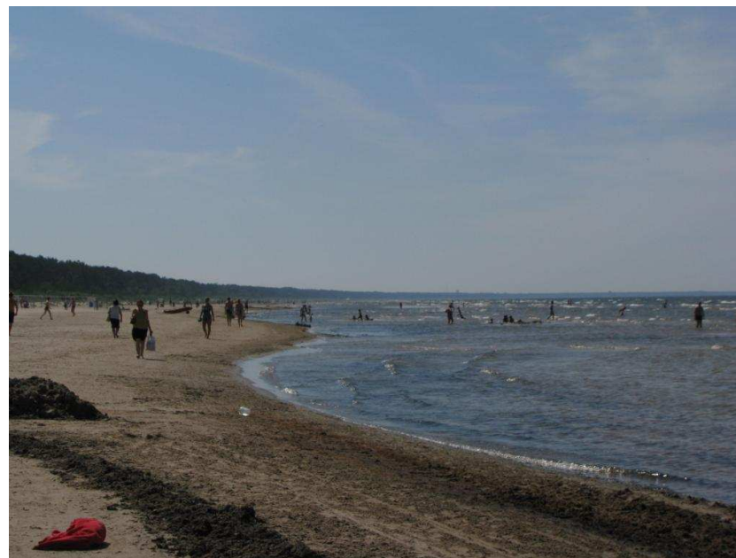
Rīgas jūras līča panorāma skatā no Dubultu pludmales Slokas ielas apkaimē