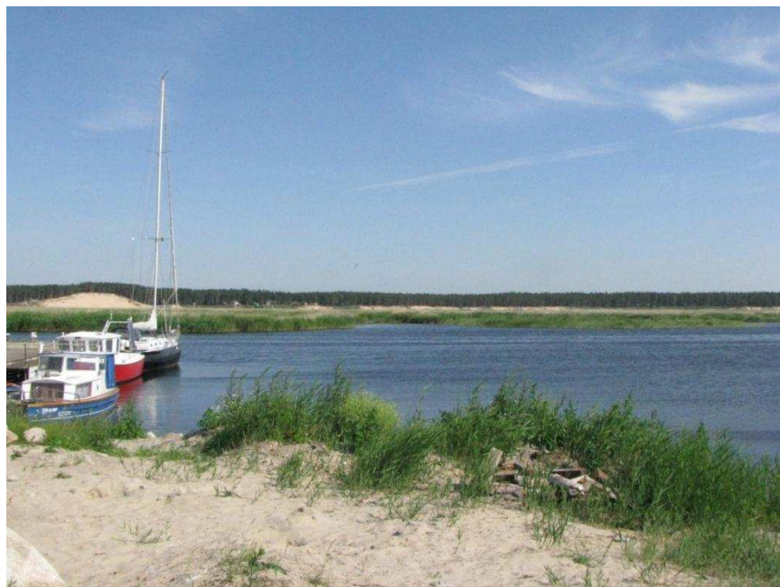
Skats pār Lielupi uz Balto kāpu no Tīklu ielas apkārtnes Buļļuciemā

Vairākums dabas teritoriju jau tiek aizsargātas sugu un biotopu saglabāšanai. Izvērtējot dabas elementus pilsētas ainavas kontekstā, to nozīmība nosakāma saistībā ar konkrētajā teritorijā iecerēto attīstības koncepciju. Vai dabas objekts un apkārtējā teritorija būtu jāaizsargā kā pilsētai raksturīgās un vērtīgās ainavas sastāvdaļa, jeb dabiska, neskarta, pat mežonīga dabas teritorija drīzāk papildina jaunu attīstības ieceri - tas izvērtējams katrā gadījumā individuāli ar apbūves priekšlikumu, detālpilānojumu, vai vizuālās ietekmes analīzi.