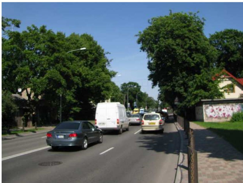
Lienes ielas perspektīva, Rīgas virziens

tikai savrupmāju un vasarnīcu rajonos, bet arī Kauguros, kur piecu un deviņu stāvu daudzdzīvokļu mājas ielu perspektīvās eksponējas perpendikulāri ielai.