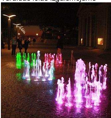
Strūklakas Turaidas ielā