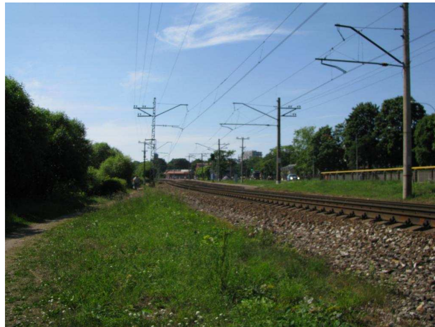
Sliežu ceļi skatā uz Majoru staciju