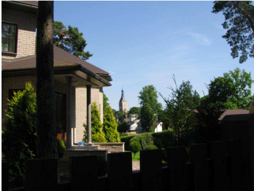
Skats uz Dubultu baznīcu no Slokas ielas

Lai īpašās skatu vietas identificētu, veicama papildus izpēte. Tikai tādā gadījumā iespējams nozīmīgās skatu vietas aizsargāt un tām uzstādīt kādus īpašus noteikumus.