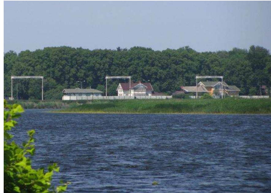
Skats pāri Lielupes līkumam uz Majoru vēsturisko apbūvi