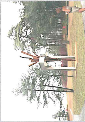
Kristaps Gulbis © 2013