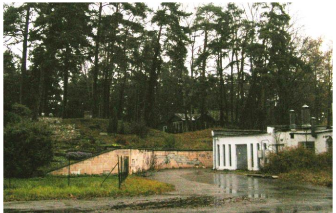
Skats uz detālpārplānojuma teritoriju no Dubulta prospekta.

Piekļūšana teritorijai ir nodrošināta no vietējās nozīmes dzīvojamās ielas – Salacas ielas, izbūvējot piebraucamo ceļu gar zemesgabala ziemeļu robežu. Saskaņā ar Jūrmalas pilsētas teritorijas plānojumu Salacas ielas ir dzīvojamās ielas, kuras nodrošina gājēju un transporta kustību dzīvojamās apbūves teritorijā. Sarkano līniju platums Salacas ielai ir 8.5m.