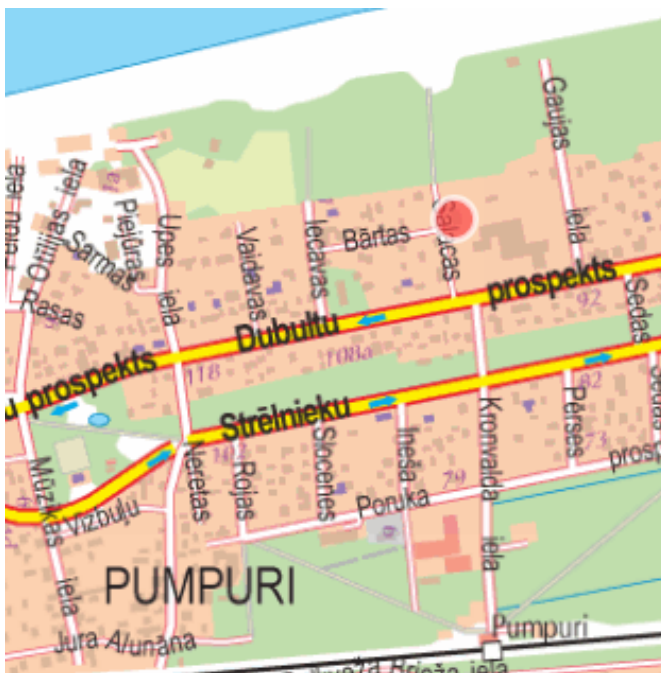
Detālplānojuma teritorijas novietojums. Shēma Nr.3.

Plānojamā teritorija 2309kv.m. platībā atrodas Jūrmalas pilsētas Pumpuru rajonā, kvartālā starp Salacas ielu, Dubultu prospektu, Gaujas ielu un pludmali.