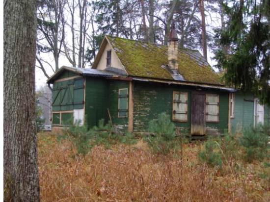
Esošā apbūve Salacas ielā 3.