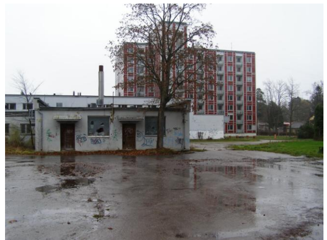
Pansionāta „Liesma” teritorija (Dubultu prospekts 101).

Detālplānojuma teritorijas austrumu robeža robežojas ar zemesgabalu Gaujas ielā 2. Esošā apbūve tika izbūvēta saistībā ar pansionāta kompleksu, pamatojoties uz 1988.gada izstrādātu projektu. Uz zemesgabala atrodas divstāvu ēka un tenisu korti. Zemesgabalam ir izstrādāts detālplānojums (Jūrmalas pilsētas domes 2012.28.06. saistošie noteikumi Nr.25), ka paredz zemesgabala sadalīšanu divās zemes vienībās un uz šīm zemes vienībām attīstīt vai nu komerciāla rakstura apbūvi, vai arī savrupmāju.