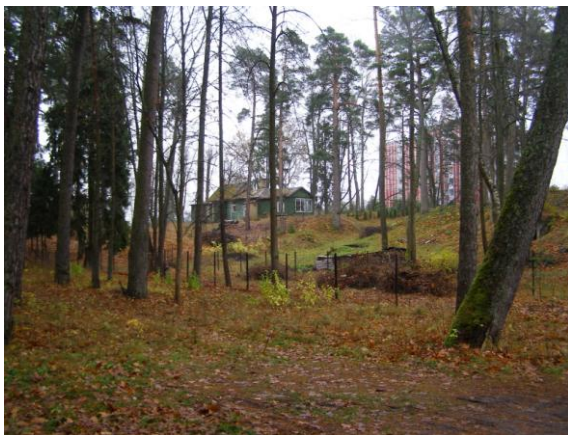
Detālpārplānojuma teritorija – skats no pieguļošās meža teritorijas.