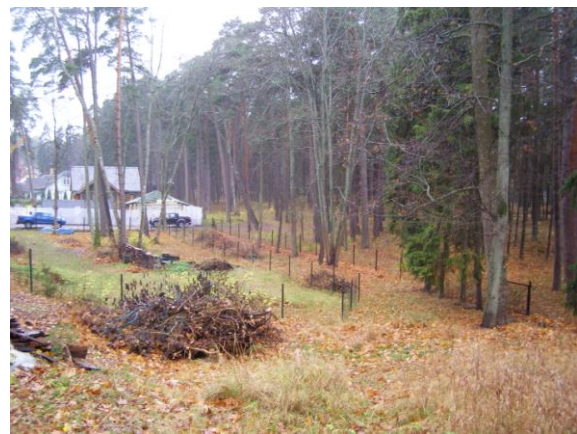
Plānotā piebraucama ceļa zona.