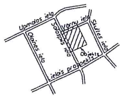
Zemes vienību izvietojuma shēma