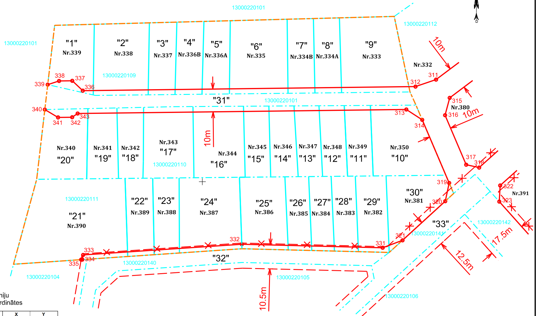
Ielu sarkano līniju lūzumpunktu koordinātes