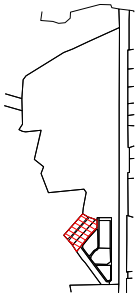
Objekta izvietojuma shēma