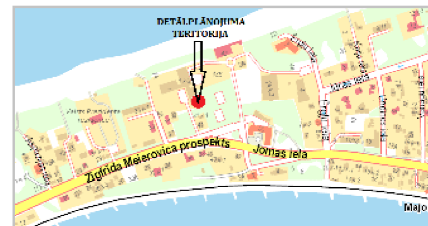
Detālplānojuma teritorijas novietojums kvartālā