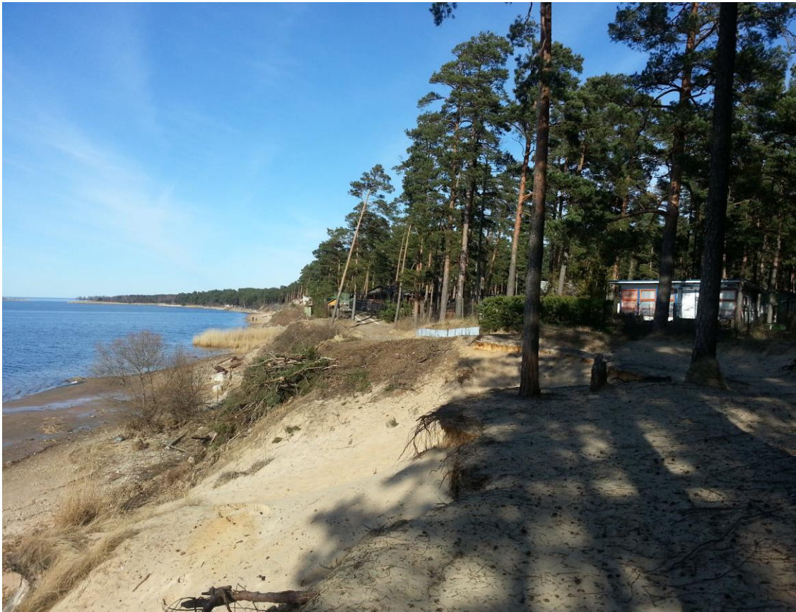
2.attēls. Lielupes krasts gar lokālplānojuma teritoriju