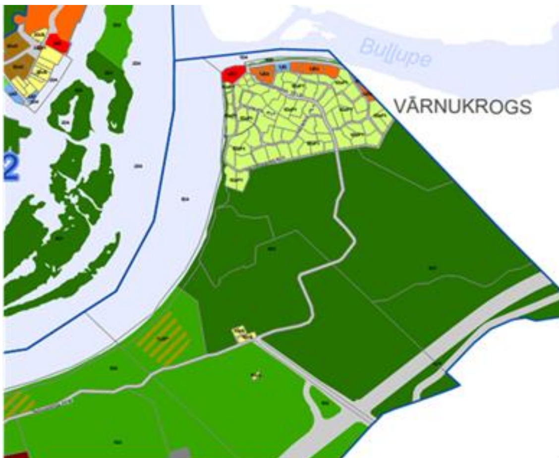
4.attēls. Aktuālais lokālplānojuma teritorijas zonējums Jūrmalas Teritorijas plānojumā