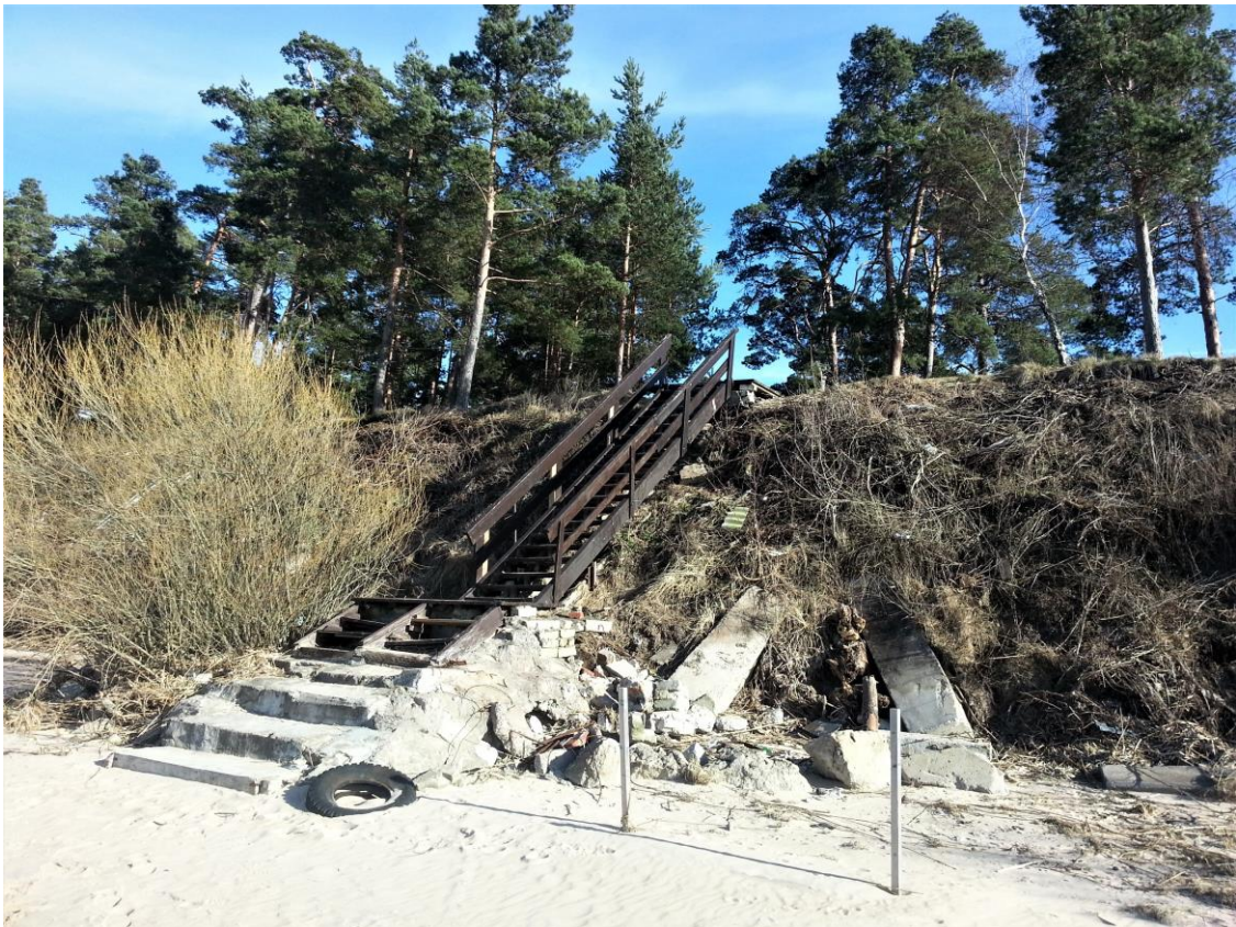
3.attēls. Organizēta piekļuve Lielupes krastam no lokālplānojuma teritorijas