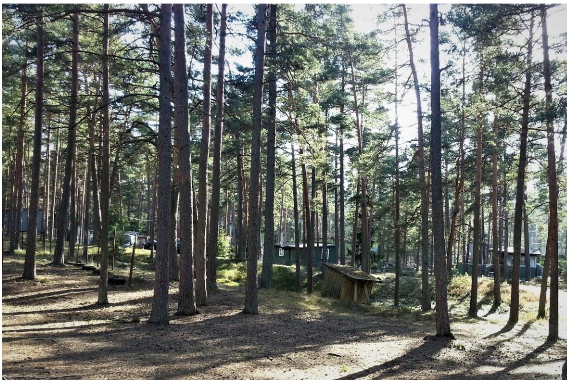
4.attēls. Skats no malas uz vēsturisko vasarnīcu apbūvi lokālplānojuma teritorijā