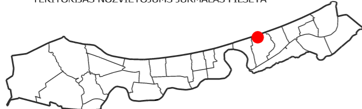
TERITORIJAS NOZVIETOJUMS JŪRMALAS PILSĒTĀ