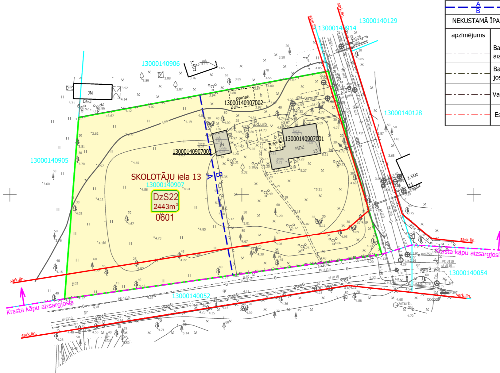
TERITORIJAS NOVIETOJUMS KVARTĀLĀ