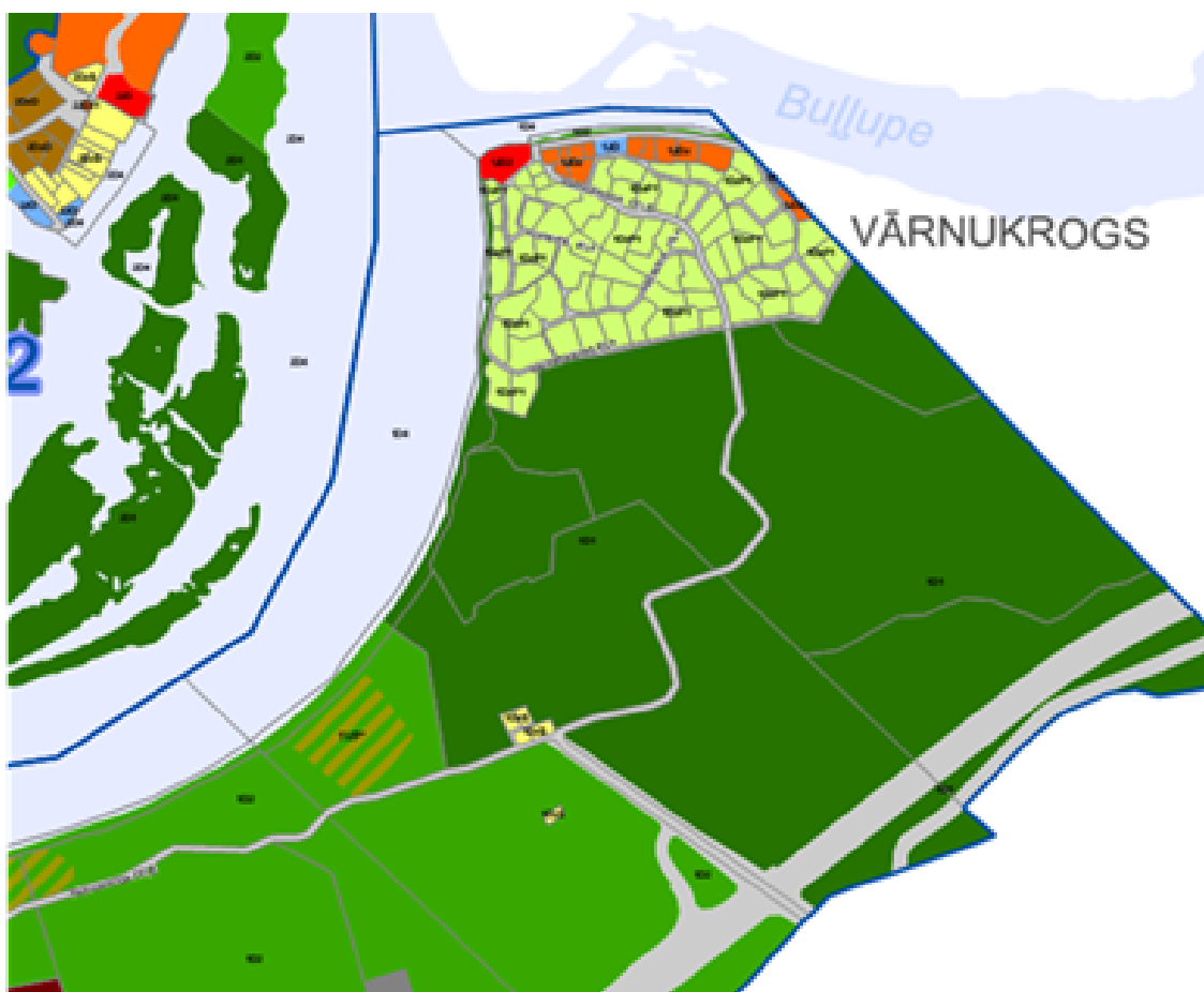
4.attēls. Aktuālais lokālplānojuma teritorijas zonējums Jūrmalas Teritorijas plānojumā