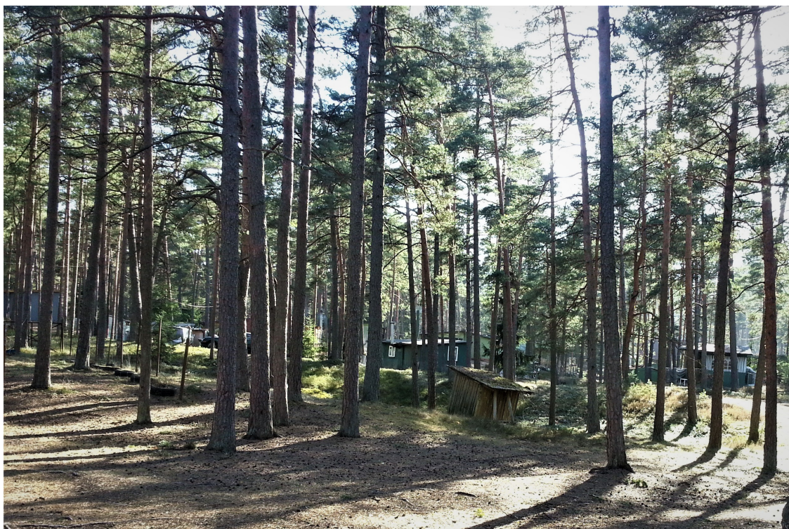
4.attēls. Skats no malas uz vēsturisko vasarnīcu apbūvi lokālplānojuma teritorijā