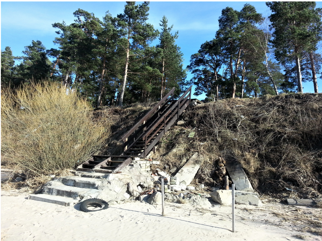
3.attēls. Organizēta piekļuve Lielupes krastam no lokālplānojuma teritorijas