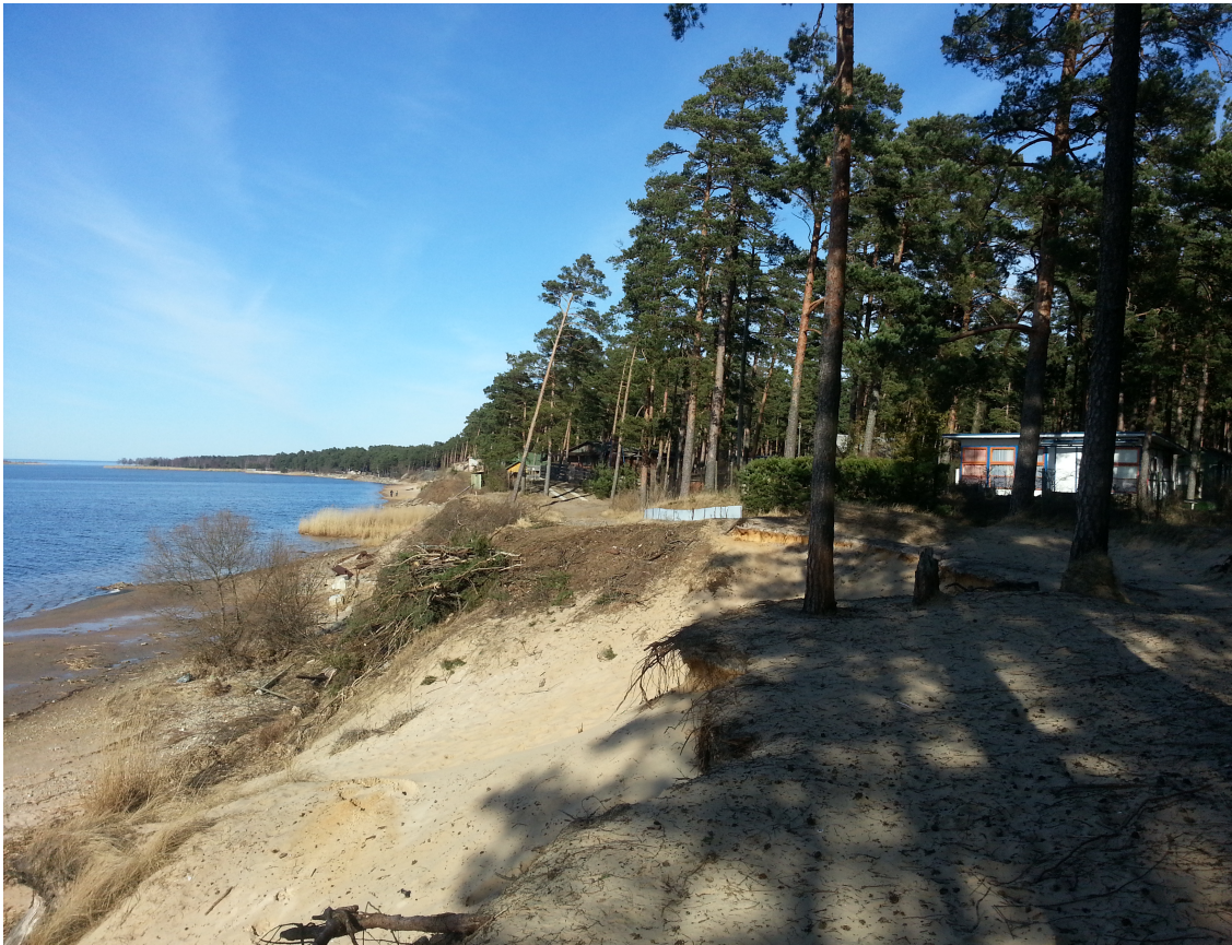
2.attēls. Lielupes krasts gar lokālplānojuma teritoriju