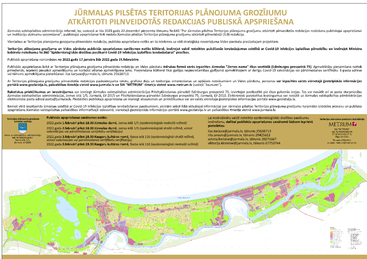
3. attēls. Informatīvs plakāts, kas tika izvietots Jūrmalas pilsētas domes telpās

Pēc publiskās apspriešanas laikā saņemto priekšlikumu un institūciju atzinumu izskatīšanas teritorijas plānojuma grozījumu izstrādes darba grupā, un ziņojuma par priekšlikumu vērā ņemšanu vai noraidīšanu sagatavošanas, Jūrmalas pilsētas dome 2021. gada 28. oktobrī pieņēma lēmumu Nr. 501 “Par Jūrmalas pilsētas teritorijas plānojuma grozījumu redakcijas pilnveidošanu”, bet 2021. gada 22. decembrī a lēmumu Nr. 640 “Par Jūrmalas pilsētas teritorijas plānojuma grozījumu atkārtoti pilnveidotās redakcijas nodošanu publiskajai apspriešanai un atzinumu saņemšanai”, tādējādi organizējot Jūrmalas pilsētas teritorijas plānojuma grozījumu atkārtoti pilnveidotās redakcijas publisko apspriešanu no 2022. gada 17. janvāra līdz 2022. gada 15. februārim. Vienlaikus tika organizēta arī tā ietekmes uz vidi stratēģiskā novērtējuma Vides pārskata precizētajam projektam.