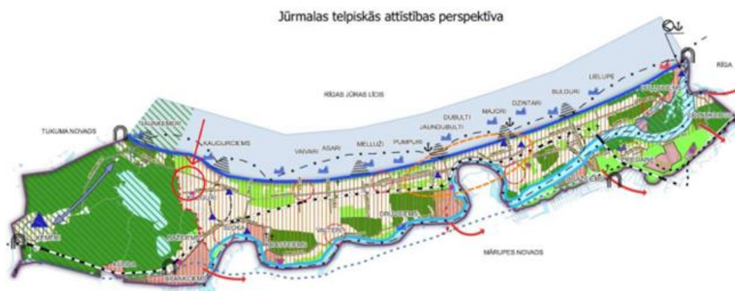
Attēls: Jūrmalas pilsētas ilgtspējīgas attīstības stratēģijas 2010-2030, grafiskās daļas karte “Telpiskās attīstības perspektīva”.

Atbilstoši Jūrmalas pilsētas ilgtspējīgas attīstības stratēģijai 2010. – 2030. gadam, tās Telpiskās attīstības perspektīvai, Lokālpārplānojuma teritorija atrodas kvalitatīvas dzīves teritorijā, pilsētas “Lielcentra” tiešā tuvumā, kā arī teritorija robežojas ar plānoto Kauguru apvedceļu. Lokālpārplānojuma teritorijai blakus atrodas īpaši aizsargājamas dabas teritorijas.