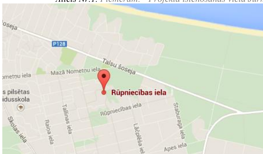
Attēls Nr.1. Piemēram: "Projekta īstenošanas vieta Jūrmalas kartē"