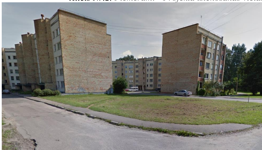
Attēls Nr.2. Piemēram: "Projekta īstenošanas vietas foto attēls"