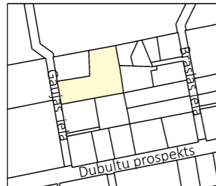
ATRAŠANĀS VIETAS SHĒMA