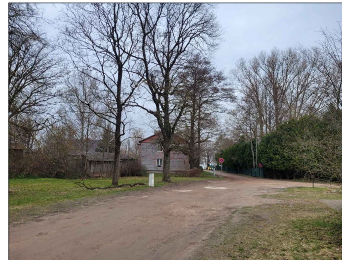
Skata punkts nr.7