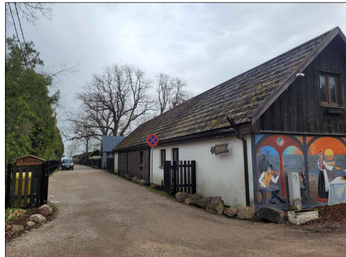
Skata punkts nr.3