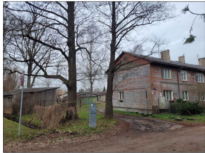
Skata punkts nr.2