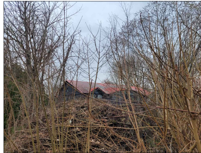
Skata punkts nr.5