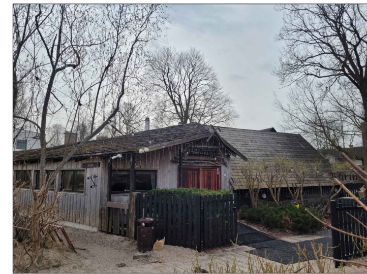
Skata punkts nr.6