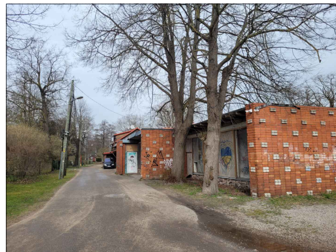
Skata punkts nr.4