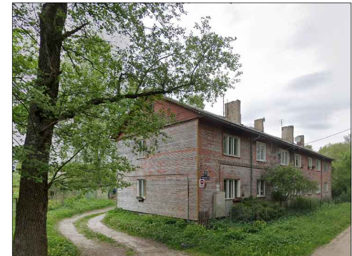
Skata punkts nr.8