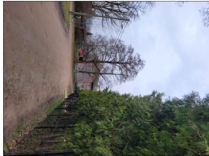
Skata punkts nr.1